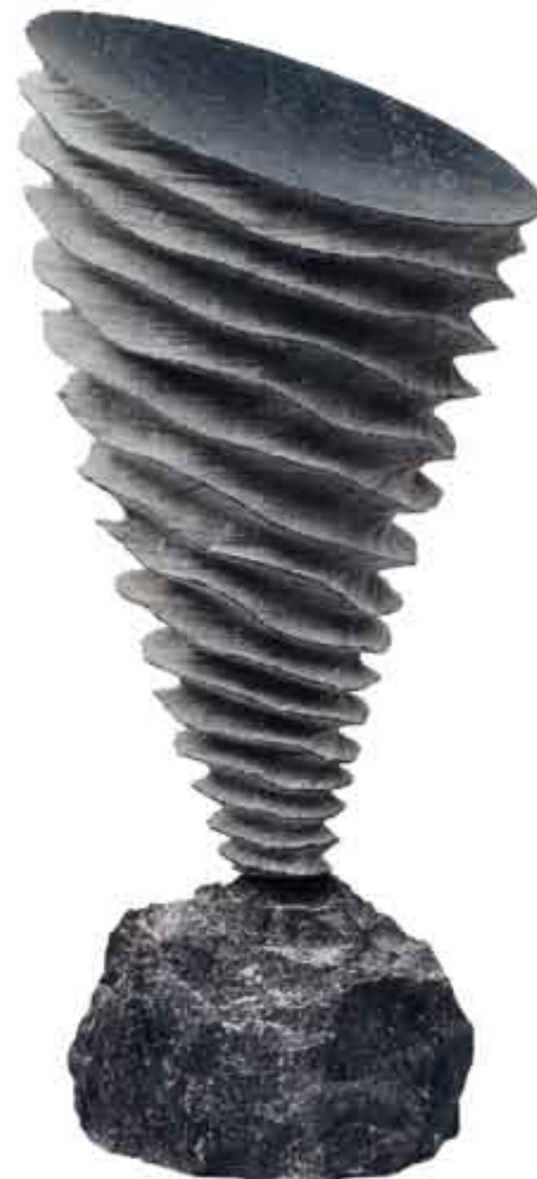
TERRE UNIVERS 1998 Pierre Bleue Belge H_61 cm L_29 cm P_29 cm