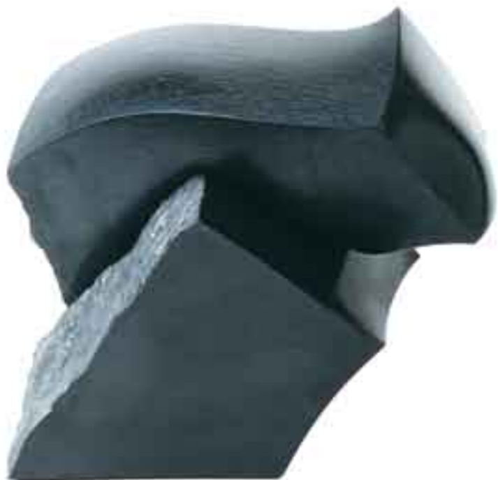
DEUX BLOCS AMOUREUX 1990 Marbre noir de Belgique H_25 cm L_26 cm P_20 cm