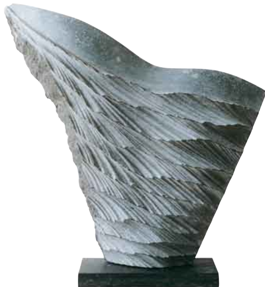
VÉNUS 2005 Pierre Bleue Belge H_56 cm L_56 cm P_15 cm