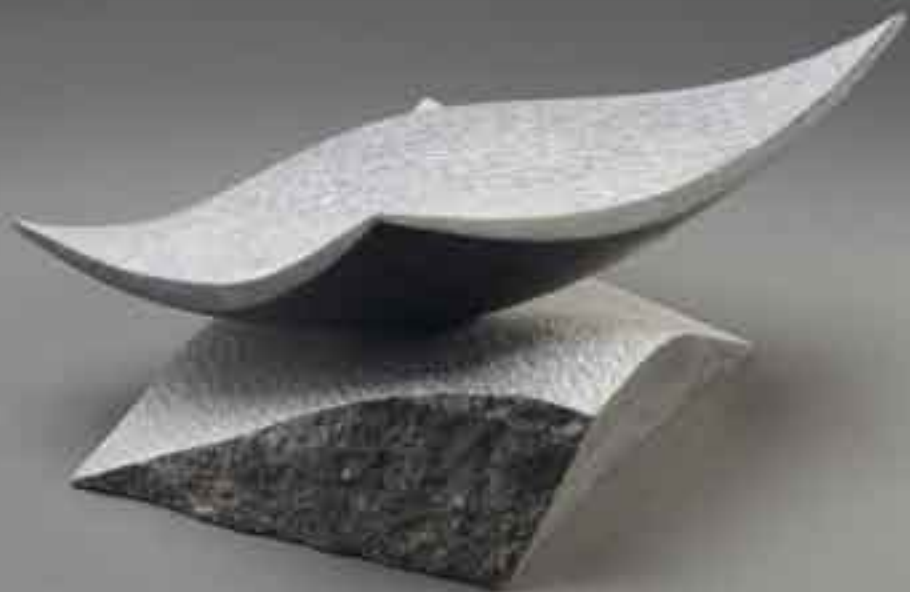
EFFEUREMENT 2010 Pierre Bleue Belge H_18 cm L_34 cm P_30 cm