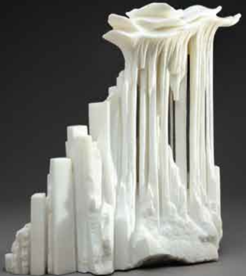
OVER NY CITY 1982 Marbre blanc de Carrare H_36 cm L_35 cm P_12 cm