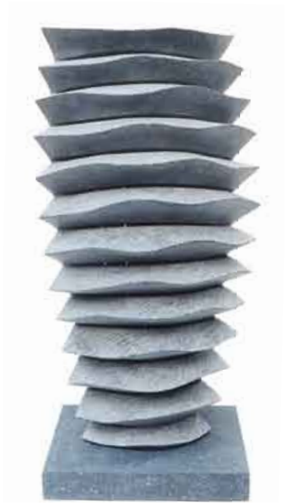
CONSTRUCTION VÉGÉTALE V 2001 Pierre Bleue Belge H_54 cm L_27 cm P_24 cm