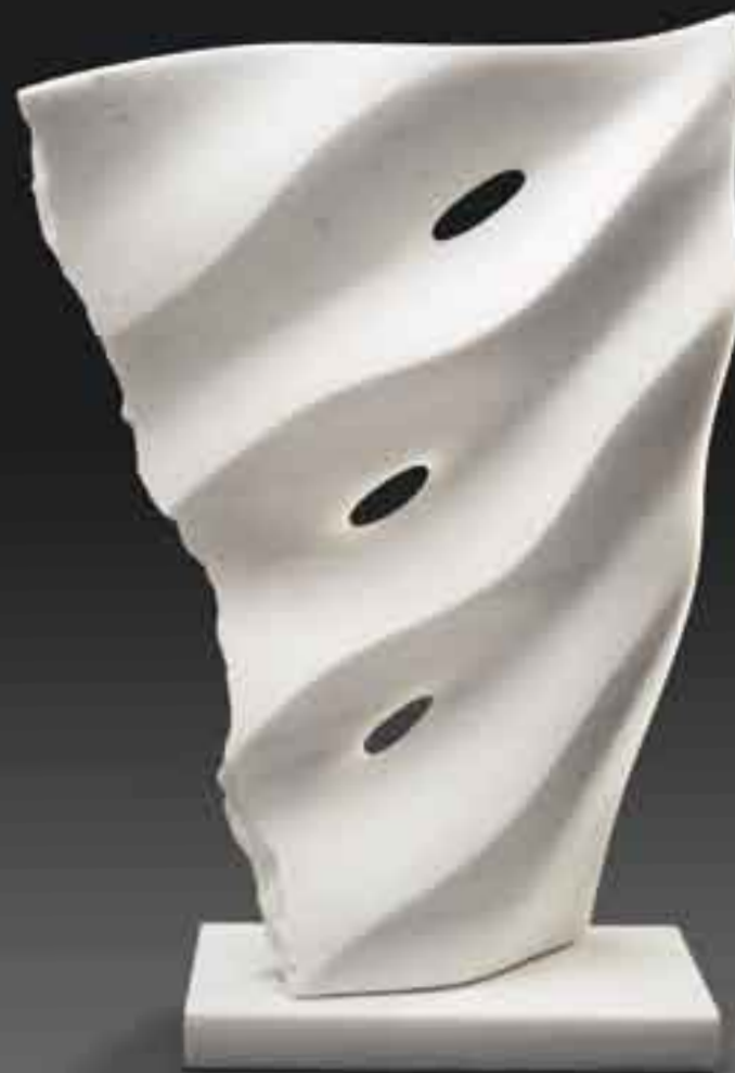
IMAGINE 2009 Marbre blanc Grec H_52 cm L_39 cm P_15 cm