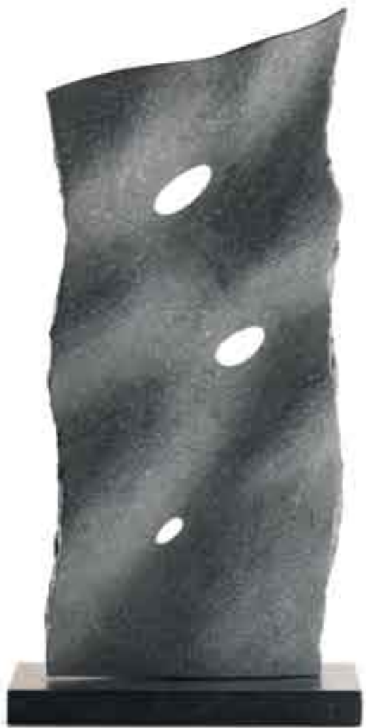
BUBBLES DREAM 2009 Pierre Bleue Belge H_65,5 cm L_32 cm P_13,5 cm