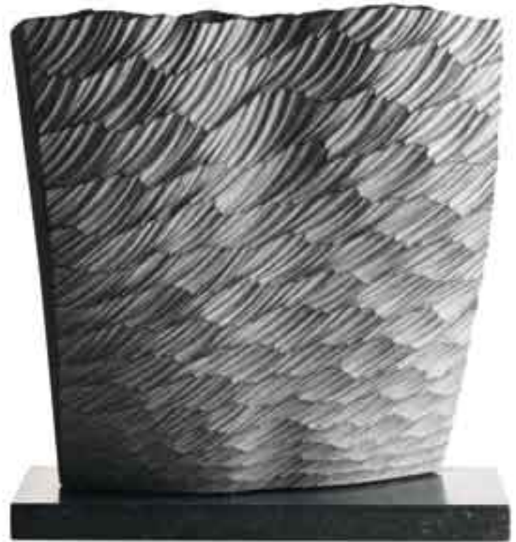
ORIGINE MER III 2008 Pierre Bleue Belge H_43 cm L_40 cm P_17 cm